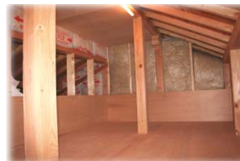
収納に便利な小屋裏収納