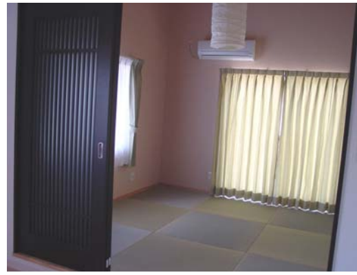
琉球畳と 斬新な照明器具がステキ！

3枚引き戸を開けるとリビングとオープンに！ 勾配天井と琉球畳により広く安らかな和室に仕上がりました。