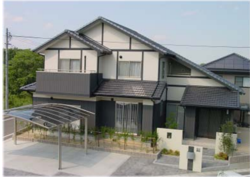
白と黒を基調とした懐かしさを 感じる新和風の外観