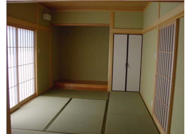
濃い茶色の建具と淡い白色の コントラストが重厚感を増します